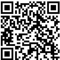
aktuelles TM zum Download

Weitere Hinweise finden Sie unter https://www.juralith.com .